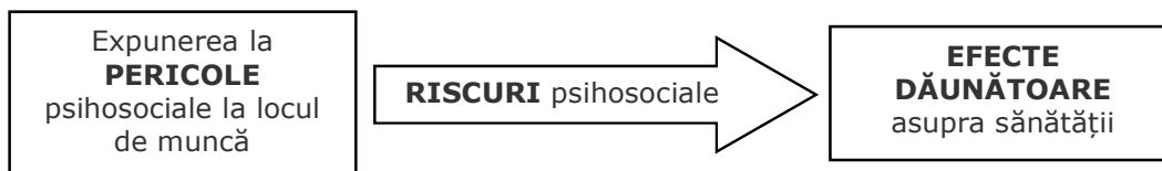
Figura 1. Pericol, risc și efect dăunător (EU-OSHA, Factori generatori și bariere în calea gestionării riscului psihosocial, adaptare după Cox, 1993 x ).

Atunci când stresul declanșează o problemă de sănătate mentală sau fizică, se impune asistență medicală. Procesul de muncă poate necesita modificări, astfel încât lucrătorul să îl poată realiza. Programele de asistență pentru lucrători, consilierea pe termen scurt și reintegrarea la locul de muncă reprezintă măsuri de remediere utile.